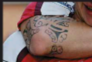
El capitán del Arsenal acudió a Luis a principios de año, en busca de un tatuaje que le diera fuerzas para recuperarse de una grave lesión. Lo hizo muy pronto.